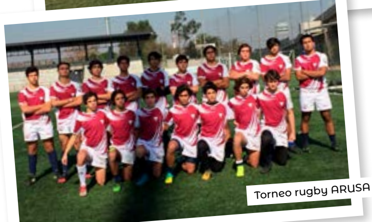
Torneo rugby ARUSA

Como parte de la formación integral de nuestros estudiantes, el Colegio Coya ofrece diversas actividades en las cuales los alumnos pueden participar. El objetivo principal es fomentar en nuestro cuerpo estudiantil valores tales como: Solidaridad, tolerancia, perseverancia y trabajo en equipo.