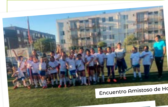
Encuentro Amistoso de Hockey